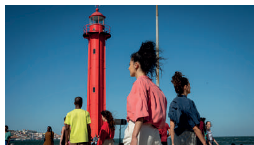
Danser ma ville

Accès libre dans la limite des places disponibles.