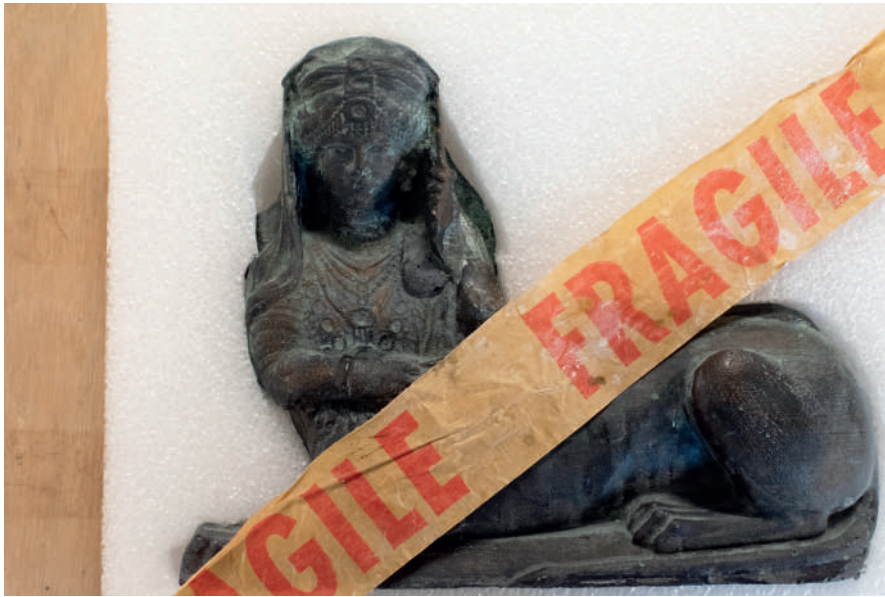
4Sphinx de Palmyre 2023 © Elias Kurdy

16 mai – 31 octobre Vernissage le 16 mai à 17h30 Château de Servières Mémoire en transit Elias Kurdy