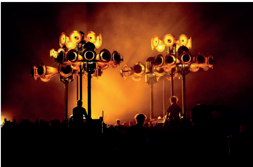
Symphonie portuaire

Coproduction : Institut Français, Ville de Marseille, Campus art Méditerranée, Lieux Publics-Centre National des Arts de la Rue et de l'Espace Public, Compagnie Mécanique Vivante.