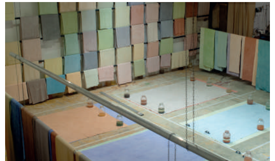
Vue d'atelier d'Adrien Vescovi

Les Musées de Marseille invitent l'artiste Adrien Vescovi à investir le Centre de la Vieille Charité. Pour la chapelle, ainsi que pour l'ensemble des coursives du site, l'artiste conçoit une installation inédite à l'échelle du monument dessiné par Pierre Puget au 17 e siècle, et qui s'inspire de ce lieu d'exception.