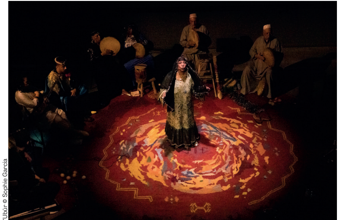
'Ubūr © Sophie Garcia

17 mai à 14h Espace Mistral, l'Estaque Concerts